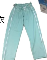
ファスナーズボン (M・L)