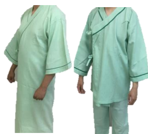
浴衣型・甚平型 (5S・4S・3S・SS・ S・M・L・LL・EL)